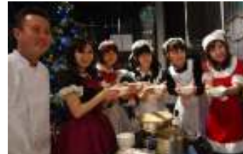
メイドさんによるスープ製作