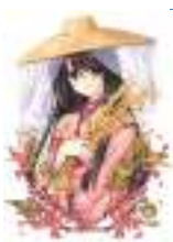
お弁当に使う全国の萌え米(秋葉原でも育成)