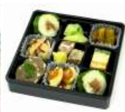
お弁当とパッケージ(イメージ) イラストは七瀬葵先生描き下ろし